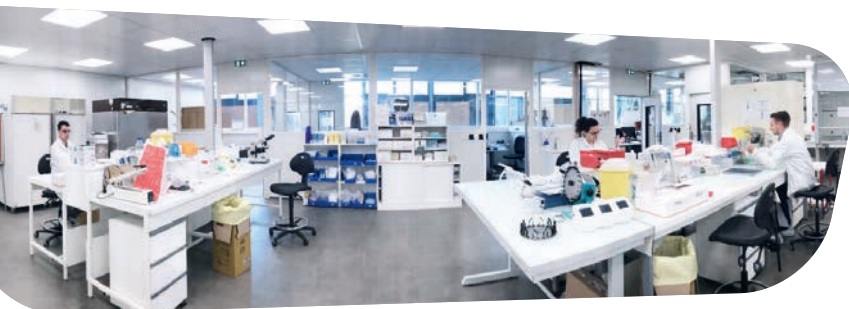
Les locaux de Biosynex à Illkirch.