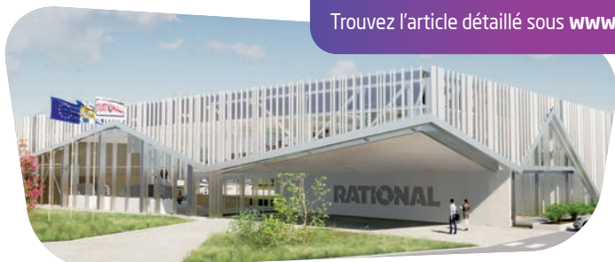
RATIONAL Wittenheim - cabinet d'architecte Société Josiane Tribble, Maître d'œuvre Est Créativ

Trouvez l'article détaillé sous www.adira.com