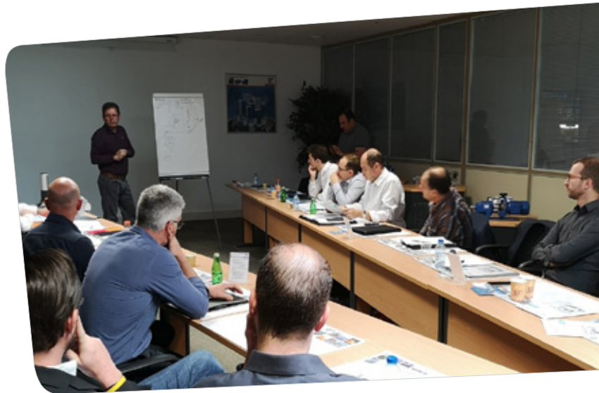
© Gemba Walk chez Nord Réducteurs organisé par l'ADIRA

L'ADIRA va continuer à proposer ce type d'actions collectives où une entreprise recueille l'expertise d'autres. Il s'agit d'un principe où les participants sont également gagnants : ils aiguisent leur vision critique et élargissent leur champ d'actions. C'est aussi pour notre agence, la possibilité de montrer comment des entreprises en collaborant peuvent favoriser leur développement et construire des réseaux locaux de partage.