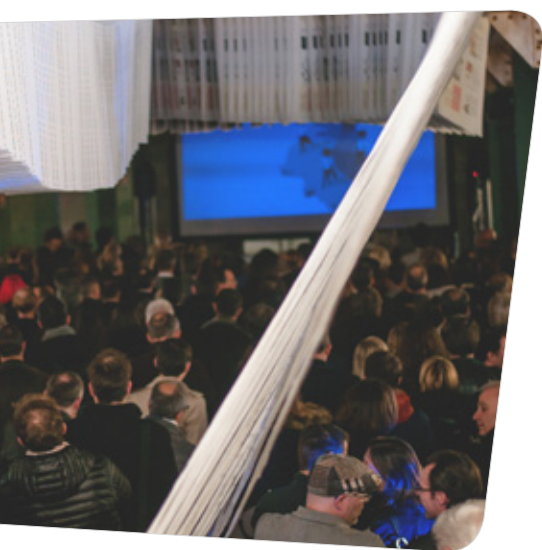
Soirée de lancement au Motoco, Mulhouse

Deux soirées de lancement animées par Dan Leclaire ont été organisées : une à Mulhouse, au Motoco, un ancien et très beau bâtiment de l'usine DMC aujourd'hui investi par des artistes, et une à Strasbourg, à l'Hôtel du Département du Bas-Rhin. Ces événements ont rassemblé plus de 1 600 personnes pour la plupart chefs d'entreprise, cadres dirigeants ou élus.