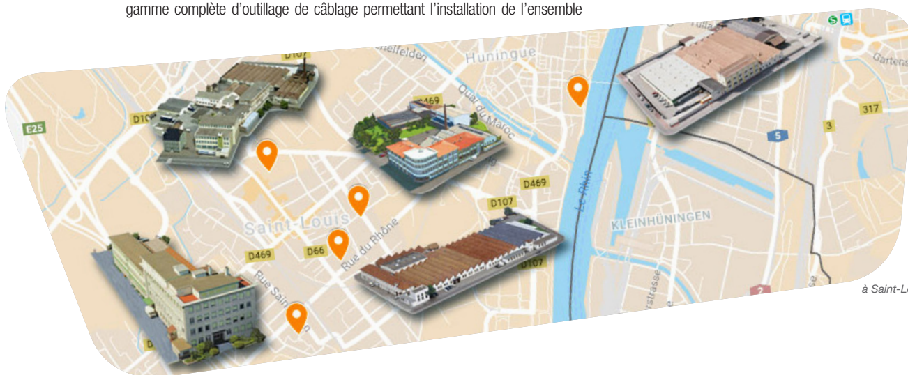
Les 4 implantations de SES STERLING à Saint-Louis

Ainsi, le Groupe SES-STERLING disposera d'un seul site de production sur le secteur 3 Frontières avec 40 000 m 2 de locaux qui accueilleront 300 collaborateurs à l'horizon 2020.